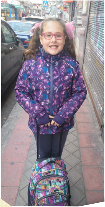
Mi último día de cole de 4º