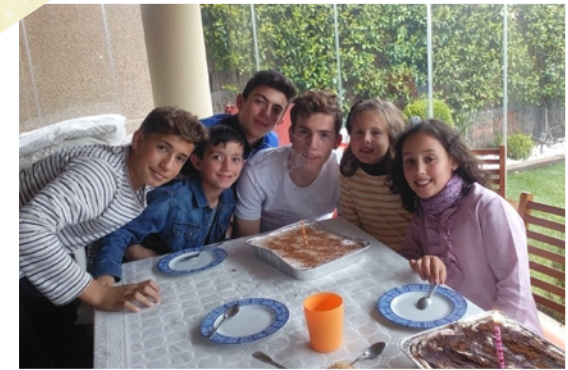
En las Rozas con mis otros primos