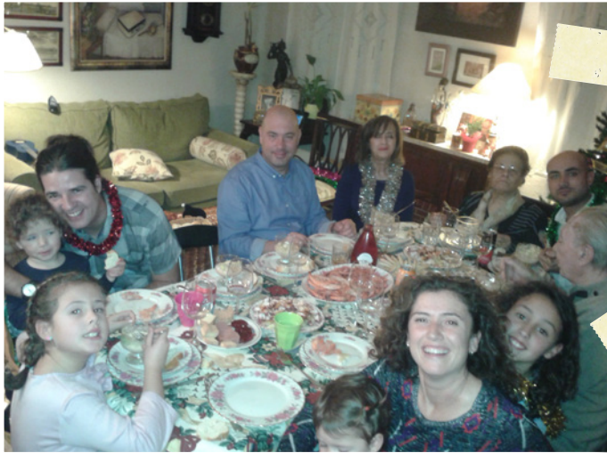
Navidades en familia