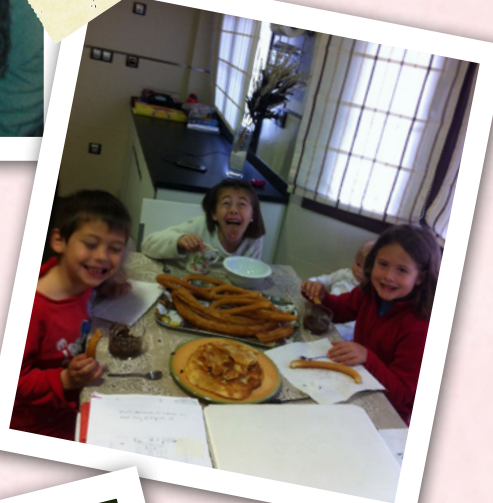
En casa de mi tía