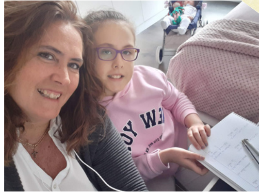
Mi madre y mi hermana me ayudan mucho.