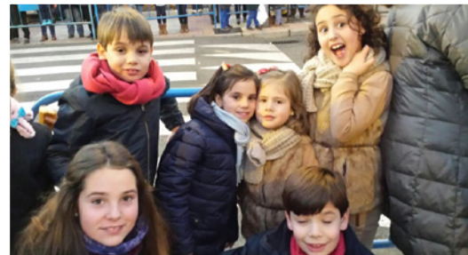
Y más primos!!!!