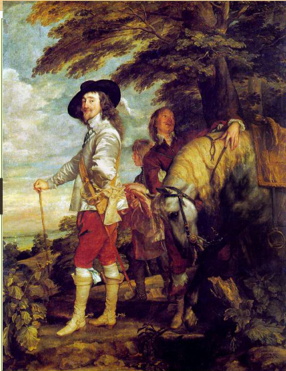
Anton Van Dyck, retrato del rey Carlos I